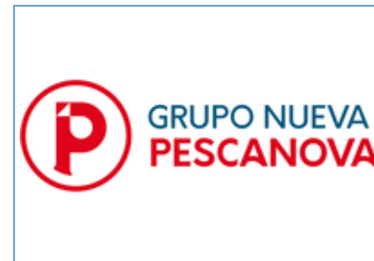
GRUPO NUEVA PESCANOVA Difusión de la contribución a los ODS en los nuevos buques del Grupo Nueva Pescanova