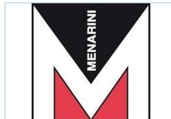
GRUPO MENARINI Exposición "Retratadas"