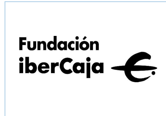
FUNDACIÓN IBERCAJA Educar para el futuro