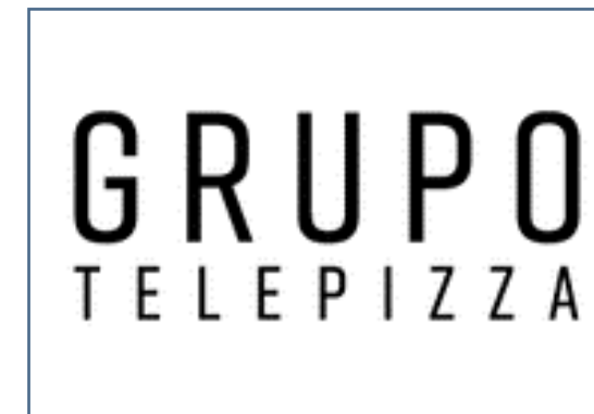
GRUPO TELEPIZZA Una cadena de valor enfocada a minimizar el desperdicio de alimentos