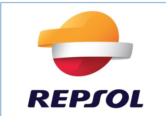
REPSOL Repsol publica su primer informe anual de ODS