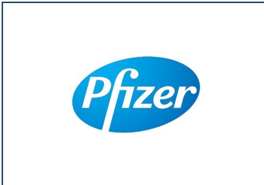
PFIZER, S.L.U Pfizer España empaqueta más de 120.000 raciones de comida para niños y niñas de África