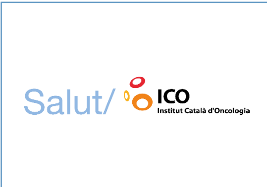
INSTITUT CATALA D'ONCOLOGIA Exposición itinerante: ¿Qué hace el ICO y qué puedes hacer tú para contribuir a los ODS?