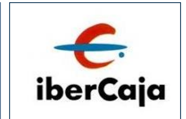
IBERCAJA BANCO S.A. Impulso solidario